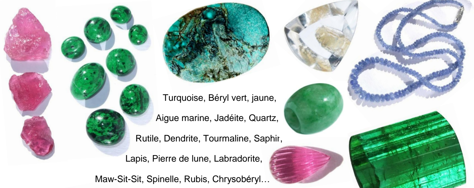
Turquoise, Béryl vert, jaune, Aigue marine, Jadéite, Quartz, Rutile, Dendrite, Tourmaline, Saphir, Lapis, Pierre de lune, Labradorite, Maw-Sit-Sit, Spinelle, Rubis, Chrysobéryl...